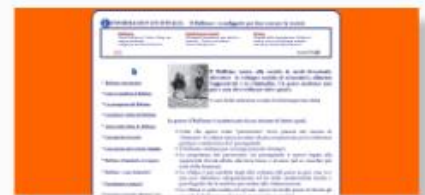
Informagiovani - Italia