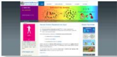
Bullismo? No Grazie!