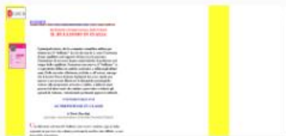
Bullismo in Italia