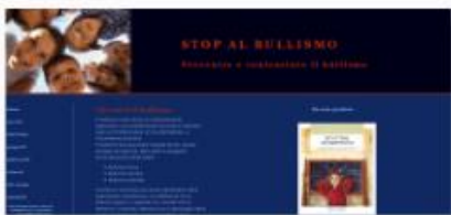
STOP al Bullismo