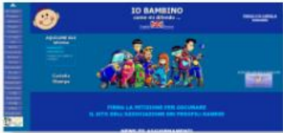
Aquilone Blu ONLUS