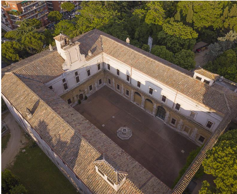
Università degli Studi Link Roma Roma, 26 e 27 Gennaio 2024