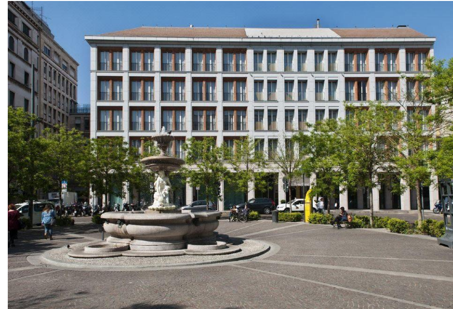
Rosa Grand Hotel Milano, 10 Febbraio 2024